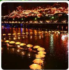
เมืองเซียนอิน