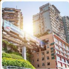
รถไฟฟ้าเกะลุตึก