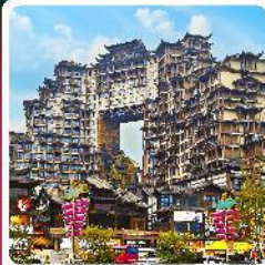
ตึกหัตถกรรม 72