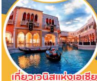
เที่ยวเวนิสแห่งเอเชีย