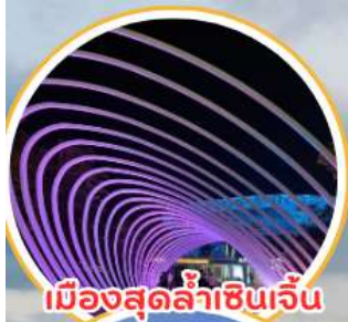
เมืองสุดล้ำเซินเจิ้น