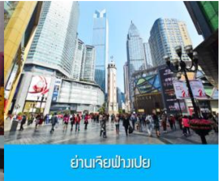
ย่านเจียฟางเปย