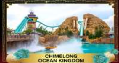
CHIMELONG OCEAN KINGDOM