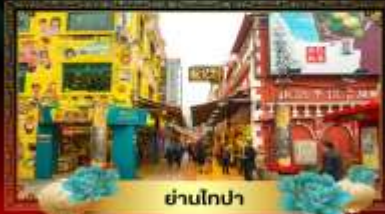
ย่านโกปา