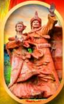
เมืองโบราณชงฟาน