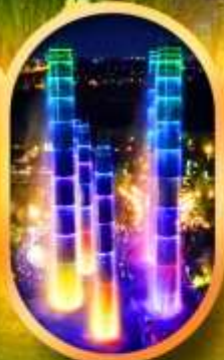
SKP Global Center