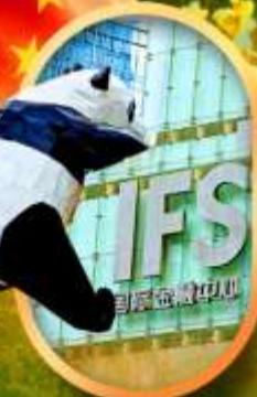
IFS หมีแพนด้าปิ่นตึก