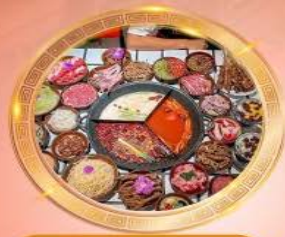
บุฟเฟต์หม้อไฟลงชิ่ง