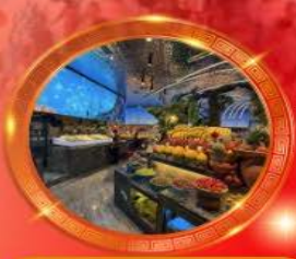
มือพิเศษ บุฟเฟต์นานาชาติ