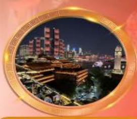
มือค้ำร้านอาหารอวโหล่งล้าม