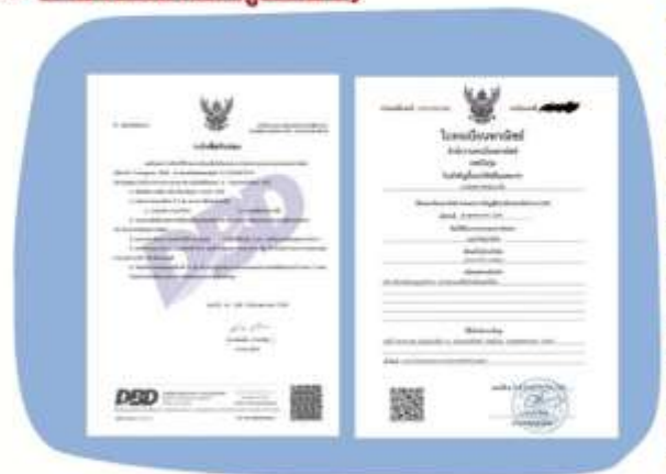
ตัวอย่างหนังสือจดทะเบียนบริษัทฯ และ ใบทะเบียนพาณิชย์