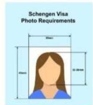
ตัวอย่างรูปถ่าย