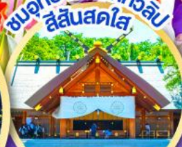
ชมอุทยานดอกทิวลิป สีแสนสดใส