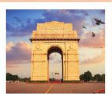
♥♦♦ India Gate