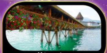
สะพานไม้ฆาปค คูซิริน