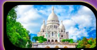
วิหารสกรเกอร์ มงมาร์ต