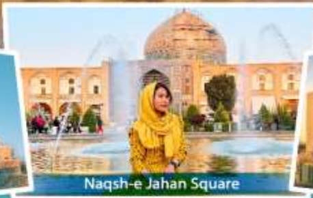
Naqsh-e Jahan Square