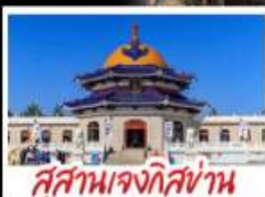
สุสานเจกิสถาน