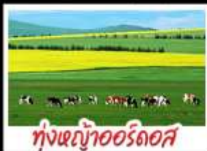
ทุ่งหญ้าจอร์โดค

ทุ่งหญ้าจอร์โดค สุสานเจกิสถาน แกรนด์แคนยอนแม่น้ำเหลือง