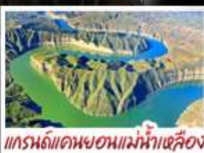
แกรนด์แคนยอนแม่น้ำเหลือง