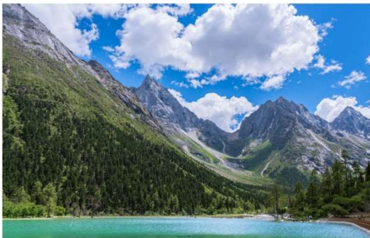
BIPENGGOU NATIONAL PARK 毕棚沟